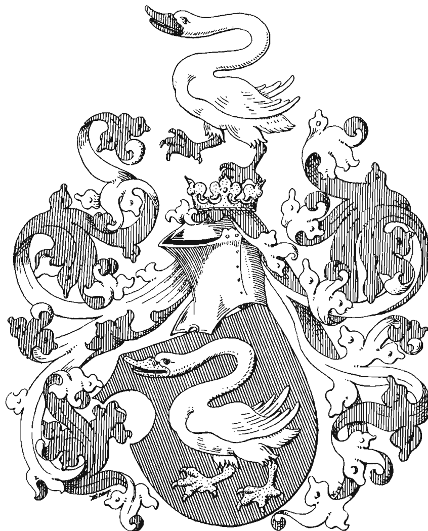
XV. ZNAK PÁNŮ ZE ŠVAMBERKA.